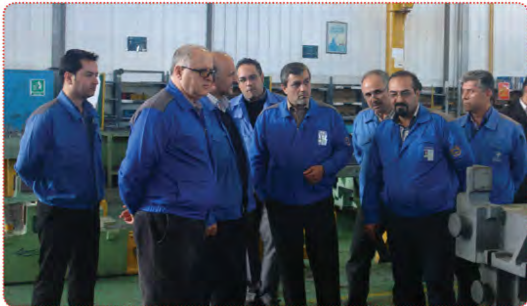
بازدید قائم مقام گروه صنعتی ایران خودرو از شرکت GPI