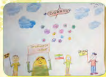
تارا صبری - ۹ ساله