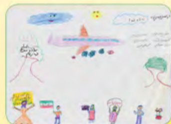
ابوالفضل مهدی زاده - ۷ ساله