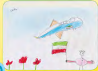
برسام نوری - ۵ ساله