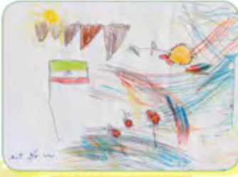
درسا توکل - ۴ ساله