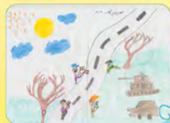
مهدي زرین گناه - ۱۵ ساله