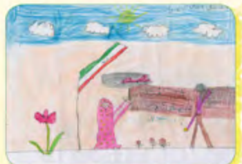
پارسا توکل - ۸ ساله