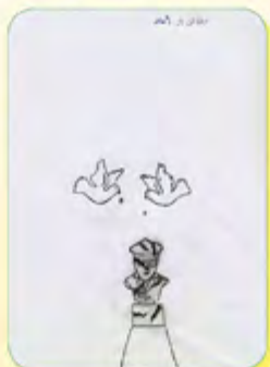
ایلیا تن باز - ۹ ساله