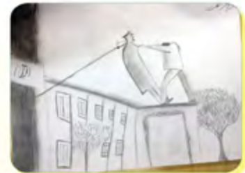
کیان نظری - ۱۶ ساله