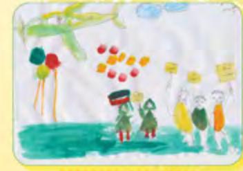
پارسا علیپور - ۴ ساله