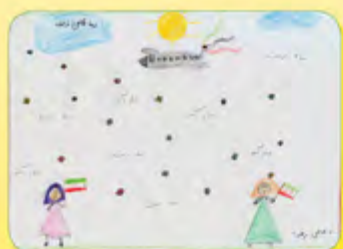
درسا طاهي فرخنده - ۷ ساله