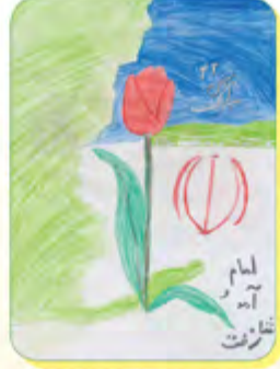
رهمیسا روا - ۱۰ ساله